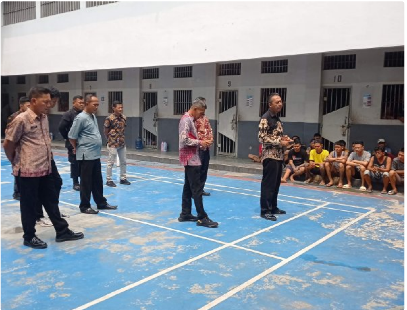
Lapas Purwokerto Tindaklanjuti Arahan Menimipas dan Kadivpas Kemenkumham Jateng

PURWOKERTO - Menindaklanjuti arahan Menteri Imigrasi dan Pemasaryakatan serta arahan dari Kepala Divisi Pemasaryakatan Kanwil Jateng Lapas Kelas IIA Purwokerto Menggelar Pengarahan kepada WBP terkait tata tertib, larangan dan